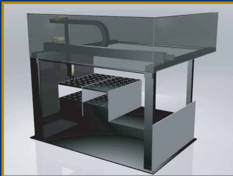
ASP 960 AutoSampler